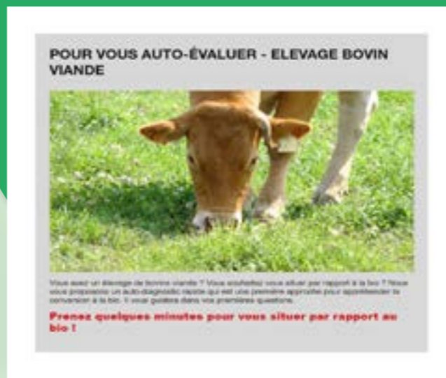
Auto-évaluation en ligne

Il s'agit d'un auto-diagnostic rapide qui est une première approche pour appréhender la conversion à la bio. Il vous guide dans vos premières interrogations.